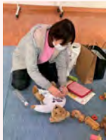
1月15日(金)10時～ 大八まち協サロにて

また、大八まちづくり協議会事務局からは、ポリエチレン袋で簡単に作れる炊き込みご飯と蒸しケーキの作り方の説明をしました。その後、参加した皆さんと防災について心配なこと、家で工夫していることなどを話しました。