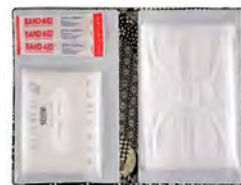
※見本画像は、さくらきりほりさんの商品紹介より掲載しています