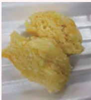
ポリエチレン袋で作った 蒸しケーキ